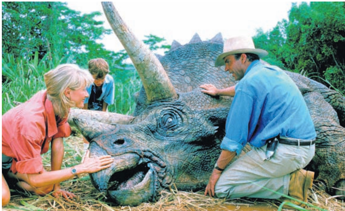
This image released by Universal Pictures shows, from left, Laura Dern, Joseph Mazzello and Sam Neill in a scene from the 1993 film "Jurassic Park."